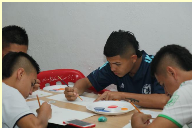
Creación de obras en el marco del proyecto "Con Zumo Cuidado" I.E Antonio Nariño, Planadas, Gaitanía - 2023.