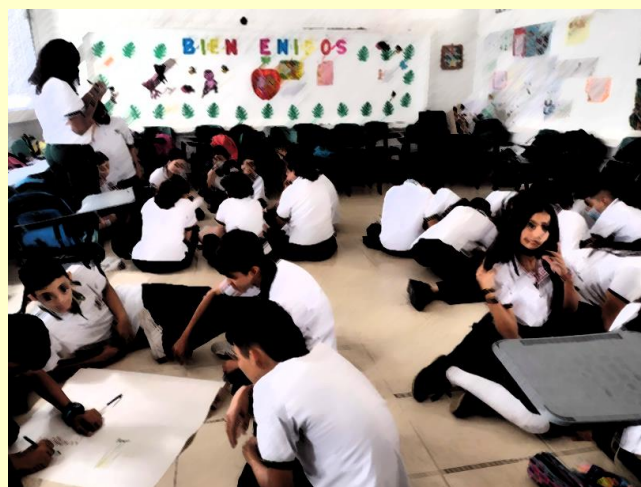
Proceso de caracterización en I.E Alberto Santofimio Caicedo, Ibagué, Tolima, 2023. Proyecto "Con Zumo Cuidado."